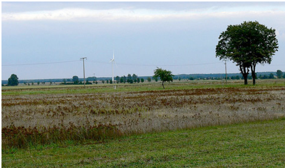
Окрестности деревушки Штреец, возможно, послужат фоном для грандиозной стройки. А пока самый заметный здесь рукотворный предмет — 100-метровый ветрогенератор.

друзьям пирамид, режиссеры обеспечили выступлению Тили соответствующий фон (внизу). Этот ролик можно посмотреть здесь , только предупреждаем — качество отвратительное.